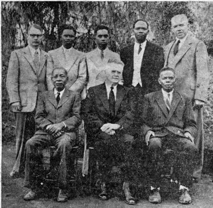
Presteskolens lærerpersonale ved 80-års jubileet.